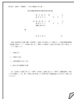
「認定低炭素住宅」を証する書類(例)

登録マンションの場合にも、各住戸ごとに【フラット35】Sの基準が確認できる書類の提出が必要です。