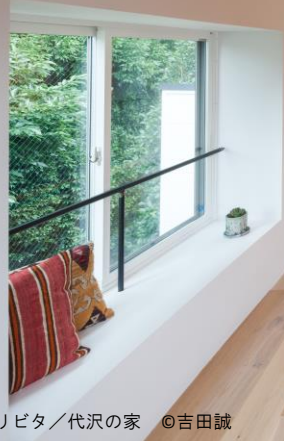
リビタ/代沢の家