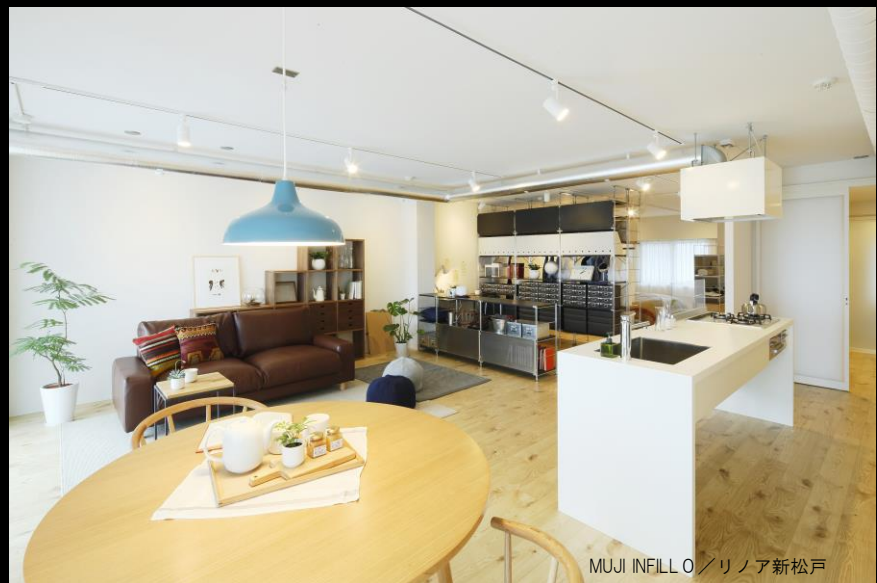
MUJI INFILL O / リノア新松戸